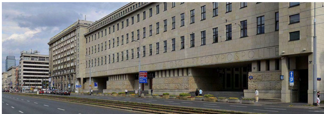
Gmach Sądu Okręgowego w Warszawie