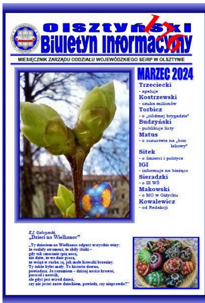
Olsztyński Biuletyn Informacyjny (176)

Zarząd Wojewódzki SEiRP w Olsztynie od 21 maja 2010 r. wydaje „Olsztyński Biuletyn Informacyjny”.